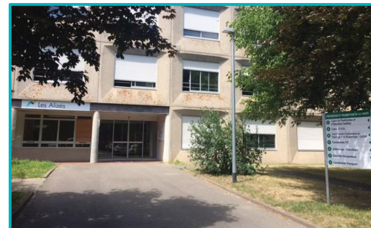
Les locaux sont situés sur le site d'Heinx